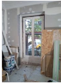
avancement au 20 novembre